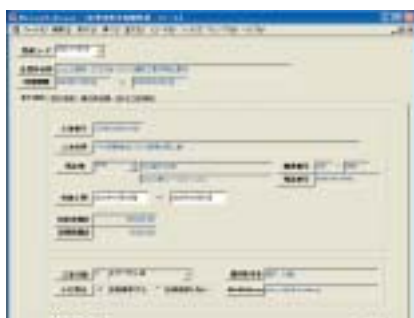
●企業体基本情報 (JV工事における企業体情報を完全装備)