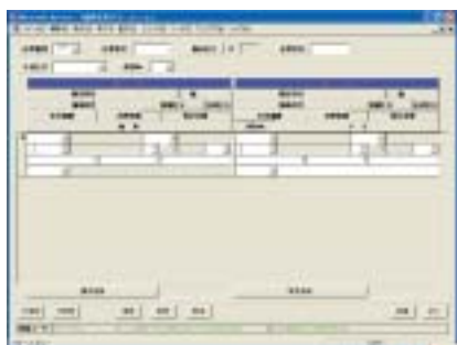
●振替伝票 (各社会計システムインターフェース可能)